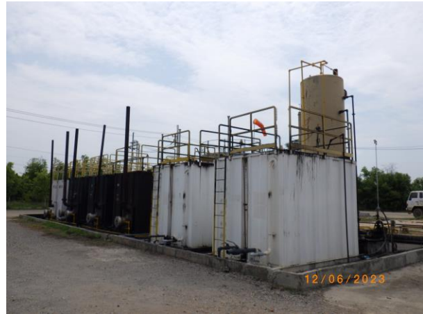
รูปที่ 1-2 พื้นที่ฐานผลิต L53-A ในระยะผลิต